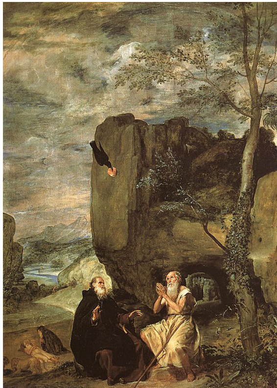
San Antonio Abad y san Pablo, primer ermitaño. Diego Rodríguez de Silva y Velázquez. Museo del Prado (Madrid).

Los panecillos de San Antón son unos dulces típicos que se encuentran en las pastelerías en estas fechas.