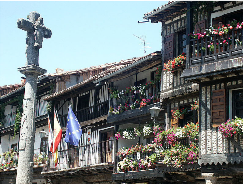
La Alberca (Salamanca).

El día 17 de enero se celebra en España la festividad de San Antonio Abad (o San Antón ).